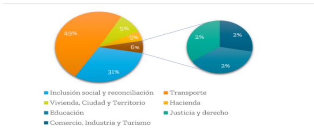
Figura 3: PGN 2021- Favorable a la reactivación.

De este modo, el comportamiento de los servicios en el segundo trimestre de 2021 se ilustra en la figura 4, en la que se advierte tasas positivas en todos los sectores de esta actividad al compararse con el mismo periodo del 2020, destacándose el crecimiento de las actividades artísticas, de entretenimiento y recreación, que estuvo en un 83,8 %, con un crecimiento del 12,6% respecto al primer trimestre del año. Es posible explicar este cambio por la caída que tuvo el sector en los meses de abril-junio del 2020, tiempo en el que se obtuvieron los más bajos ingresos en todo este año (Departamento Administrativo Nacional de Estadística [DANE], 2020f), así como en el progreso del