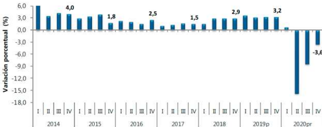
Gráfico Producto Interno Bruto (PIB) Tasas de crecimiento en volumen 1 2014-I-2020 pr -IV

Fuente: DANE, Cuentas nacionales 1 Serie encadenadas de volumen con año de referencia 2015 pr preliminar p provisional