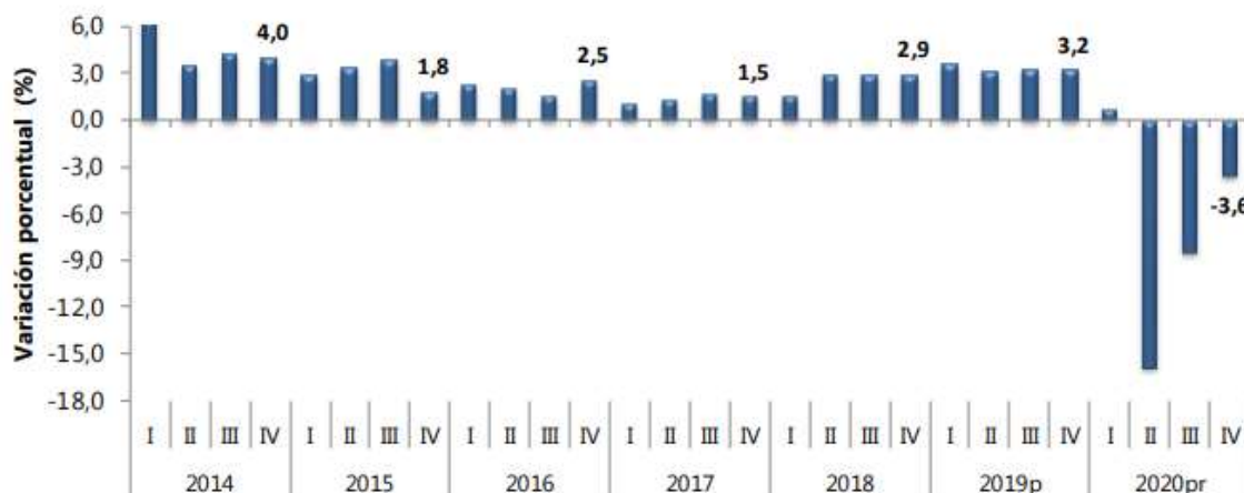
Gráfico 1. Producto Interno Bruto (PIB) Tasas de crecimiento en volumen 1 2014-I-2020 pr -IV