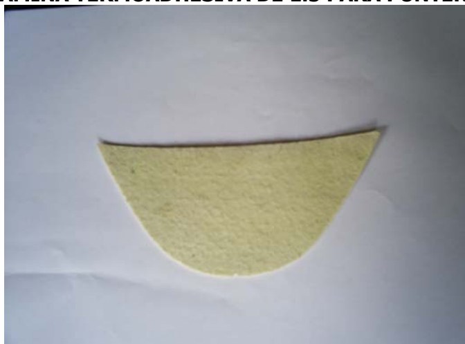
FIGURA N°1. LÁMINA TERMOADHESIVA DE 1.5 PARA PUNTERA.