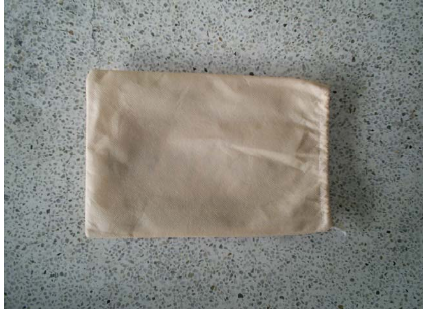
FIGURA No. 4 PRESENTACIÓN COJÍN DE RECARGA.