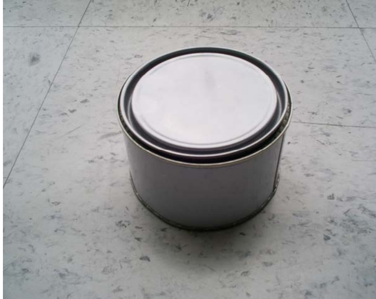
FIGURA No. 2 PRESENTACIÓN PARRILLA.