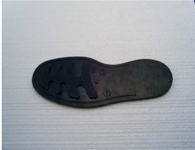
FIGURA No. 1 VISTA SUPERIOR DE LA SUELA LABRADA PARA BOTA.