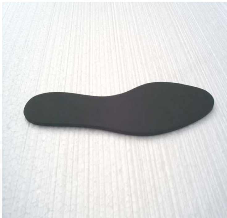
Figura No. 2. PLANTILLA PREFORMADA DE CAUCHO